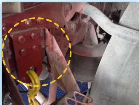
Placas en tractora.

Basta que la respuesta a sólo una de estas preguntas sea SÍ para que SU PROCEDIMIENTO DE INSPECCIÓN MÁS ADECUADO SEA LA SIMULACIÓN DE CARGAS.