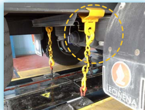
Semiremolque con bastidor estándar, no necesita adaptación.

ADAPTAMOS SU VEHÍCULO PARA QUE PUEDA IR A ITV SIN CARGA, TANTO CON TOMAS DE PRESIONES COMO CON PLACAS PARA SIMULACIÓN.